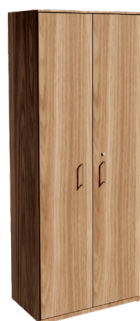
ARMÁRIO EXTRA ALTO