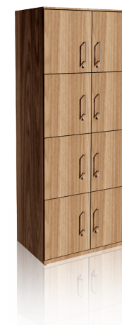
ARMÁRIO GUARDA VOLUMES