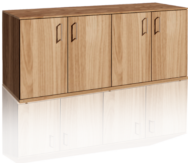
ARMÁRIO BAIXO 4 PORTAS