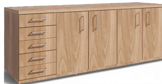
ARMÁRIO COM GAVETAS E PORTA