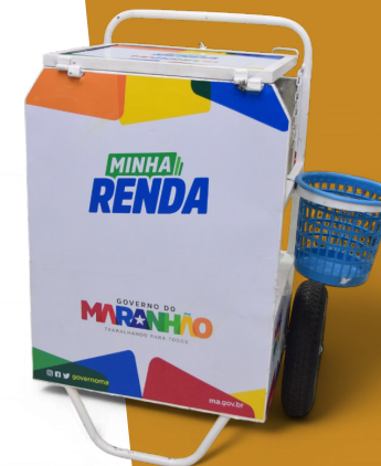
CARRINHO DE OSTRAS