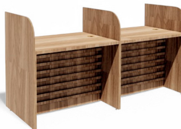
GUICHÊ DE ATENDIMENTO 2 LUGARES