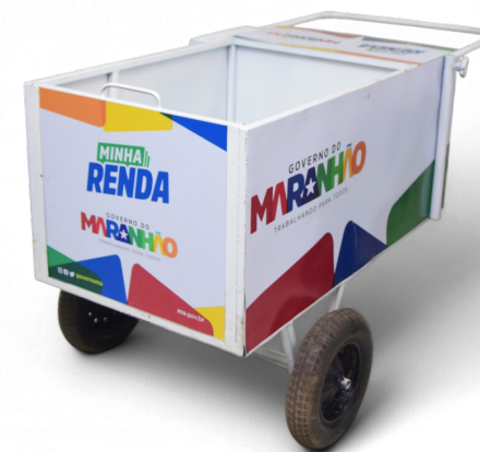
CARRINHO DE MILHO